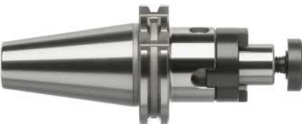
N° de réf. 001-015, 061