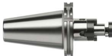
N° de réf. 050-060, 062-064