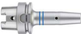
N° de réf. 103-332