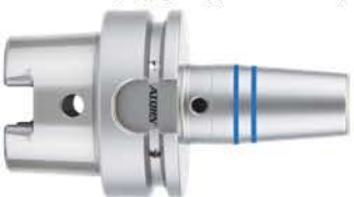
N° de réf. 003-032