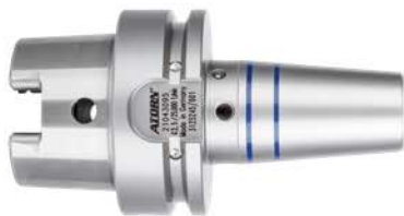
N° de réf. 503-514, 518-520